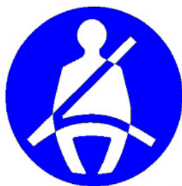
Obr. č. 5.: Piktogram na označenie miesta s bezpečnostnými pásmi.