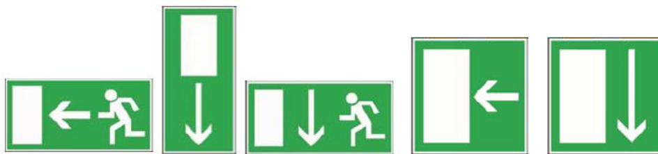
Obr. č. 1.: Symboly označujúce núdzový východ.

Pri každom ovládači núdzového východu musí byť stručný a jasný návod na jeho použitie. Časti kľbového autobusu sa na účel tejto predpísanej podmienky pokladajú za samostatné vozidlo.