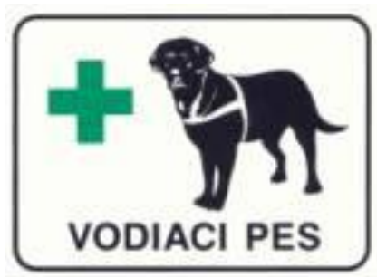
Obr. č. 6.: Príklad piktogramu na označenie vyhradeného miesta pre vodiaceho psa