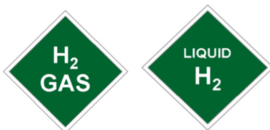
Obr. č. 3d: Príklad označenia vozidla s pohonným systémom na stlačený (plynný) vodík a skvapalnený vodík