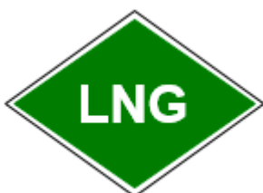
Obr. č. 3c: Príklad označenia vozidla s pohonným systémom na skvapalnený zemný plyn