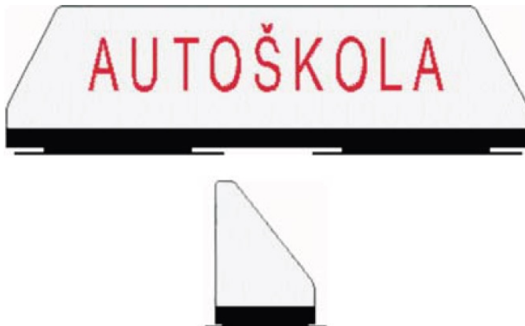
Obr. č. 2.: Príklad vzhľadu odnímateľného transparentu výcvikového vozidla autoškoly