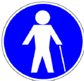
Obr. č. 6.: Piktogram na označenie prioritného sedadla vyhradeného pre cestujúcich so zníženou pohyblivosťou.

Piktogram podľa osobitného predpisu 47) na označenie prioritného sedadla vyhradeného pre cestujúcich so zníženou pohyblivosťou musí mať priemer aspoň 130 mm a vzhľad podľa vzoru na obr. č. 6. Alternatívny piktogram podľa osobitného predpisu 48) musí mať vzhľad podľa vzoru na obr. č. 7.