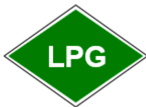
Obr. č. 3b: Príklad označenia vozidla s pohonným systémom na skvapalnený ropný plyn

vycentrované na stred nálepky. Toto označenie musí byť dobre viditeľné pre ostatných účastníkov cestnej premávky.