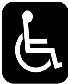
Obr. č. 5.: Piktogram na označenie priestoru pre vozíky na prepravu osôb s telesným postihnutím.

Piktogram podľa osobitného predpisu 47) na označenie prioritného sedadla vyhradeného pre cestujúcich so zníženou pohyblivosťou musí mať priemer aspoň 130 mm a vzhľad podľa vzoru na obr. č. 6. Alternatívny piktogram podľa osobitného predpisu 48) musí mať vzhľad podľa vzoru na obr. č. 7.