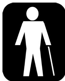
Obr. č. 7.: Piktogram na označenie prioritného sedadla vyhradeného pre cestujúcich so zníženou pohyblivosťou.