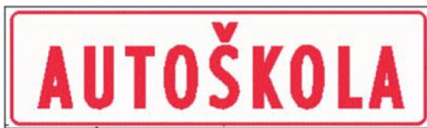
Obr. č. 3.: Príklad vzhľadu odnímateľnej reflexnej fólie výcvikového vozidla autoškoly

Poznámka: Pri technickej kontrole nemusia byť označenia výcvikového vozidla autoškoly na vozidle nainštalované, musia však byť prítomné vo vozidle. V prípade transparentu sa vyskúša i jeho presvetlenie.