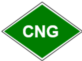
Obr. č. 3a: Príklad označenia vozidla s pohonným systémom na stlačený zemný plyn